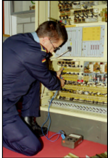
Kontrolle am Schaltschrank

Von Soldaten der Verwendungsreihe 43 wird technisches Verständnis, handwerkliche Fertigkeit und Verantwortungsbewusstsein verlangt.