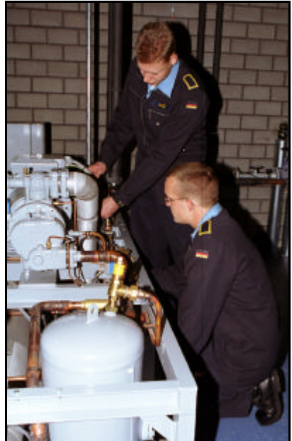
Erläuterung der Kaltluftklimaanlage

Von Soldaten der Verwendungsreihe 44 wird technisches Verständnis, handwerkliche Fertigkeit, Verantwortungsbewusstsein und Einsatzbereitschaft verlangt.