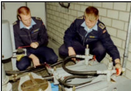
Ausbildung an Flugkraftstoffanlage

Eingangsberufe für diese Verwendungsreihe sind alle Metall be- und verarbeitende sowie elektrotechnische Berufe.