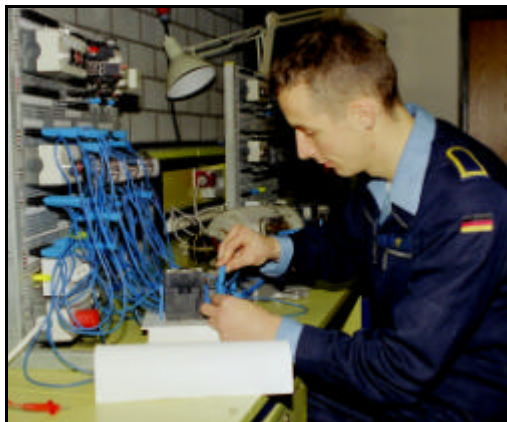
Ausbildung am Arbeitsplatz Schutzschaltungen