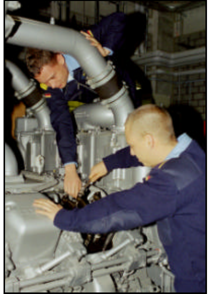
Wartung Antriebsdieselmotor Fregatte F124

Von Soldaten der Verwendungsreihe 42 wird technisches Verständnis, handwerkliches Geschick und Verantwortungsbewusstsein verlangt.