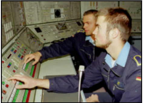
Arbeit im schiffstechnischen Leitstand Fregatte F122