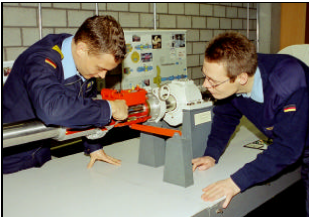
Ausbildung an Verstellpropelleranlage