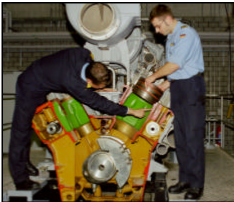
Funktionserläuterung am Teilmotor Antriebsdieselmotor Fregatte F122

Eingangsberufe für diese Verwendungsreihe sind alle Metall be- und verarbeitenden Berufe.