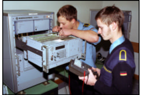
Fehlersuche an einer Funksendeanlage

Die Marineelektroniker sind die Instandhalter und Instandsetzer - im begrenzten Umfang auch die Bediener - der umfangreichen elektronischen Anlagen und Geräte, die auf Schiffen, Booten und in Stützpunkten installiert sind.