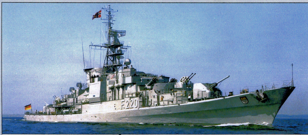
Fregatte "KÖLN" während einer Ausbildungsreise

Im August 62 nahm die „KÖLN“ am NATO-Manöver "Doorkeeper" teil und besuchte bei einer Auslandsreise im Nordatlantik vom 03. bis 21.09. Funchal auf Madeira, Vigo in Spanien sowie das