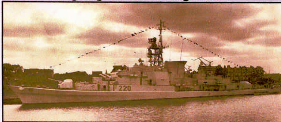
Nach der Indienststellung 1961