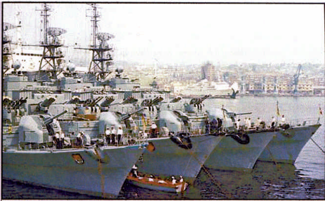
Das 2. Geleitgeschwader im "Päckchen" 1977 in Neapel

Im Frühjahr 1982 unternahm die "KÖLN" ihre letzte Ausbildungsreise in den Atlantik und ins Mittelmeer. Im Mai nahm die Fregatte an dem NATO-Manöver "Bright Horizon" teil und verlegte dann zur "Entwaffnung" ins Marinearsenal Wilhelmshaven. Am 17.12.1982 wurde die "KÖLN" endgültig außer Dienst gestellt.