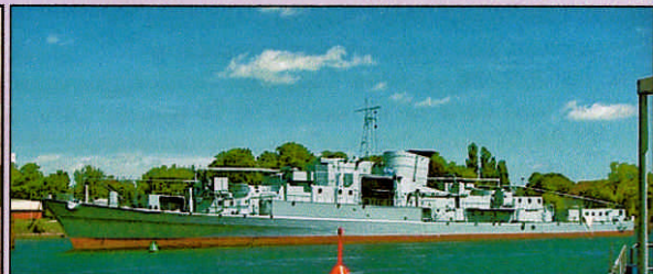
Heute als Übungshulk in Neustadt/ Holstein

In fast 20 Dienstjahren legte die "KÖLN" 310.000 Seemeilen zurück. Nach der Demilitarisierung verlegte "F-220" im November in die Norderwerft nach Hamburg wo sie zu Übungs- und Ausbildungshulk für die Schiffssicherungslehrgruppe umgebaut wurde.