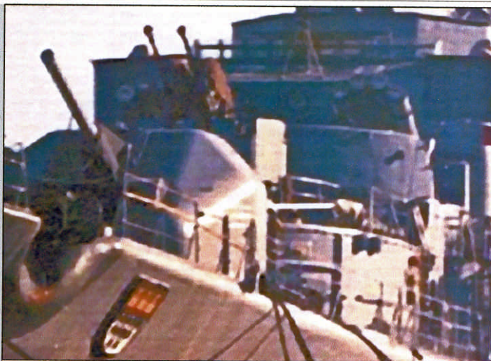
10 cm Geschütz, 4 cm Zwillingsflak und UJagd-Raketenwerfer

Im April 1971 ging "KÖLN" zur Generalüberholung in die Werft und war am 02.05.72 wieder einsatzklar. Vom 14.09. bis 28.09. nahm die Fregatte am NATO-Manöver "Strong Express" teil und lief Ende Oktober zum Training nach Portland. Am 14.12. war die "KÖLN" in Wilhelmshaven zurück und lief bereits am 22.01.73 zum Manöver "Sunny Seas 73" aus. Nach der Übung folgte die "SEF 1/73" mit dem Besuch von Kopenhagen. Vom 15. bis 26.03.74 FOST in Portland, anschließend mehrere "SEF's" bei denen Arendal in Norwegen, Kopenhagen und Kristiansand besucht wurden. Im Juni 75 ging die "KÖLN" zur generalüberholung nach Bremerhaven in die Werft und nach Probefahrten war die Fregatte im Mai 1976 wieder einsatzbereit. Im Juni 76 wurden Landziel Schießübungen vor Cape Wrath im nördlichen Schottland durchgeführt und vom 12.10. bis 24.11.76 folgten Übungen vor Portland.