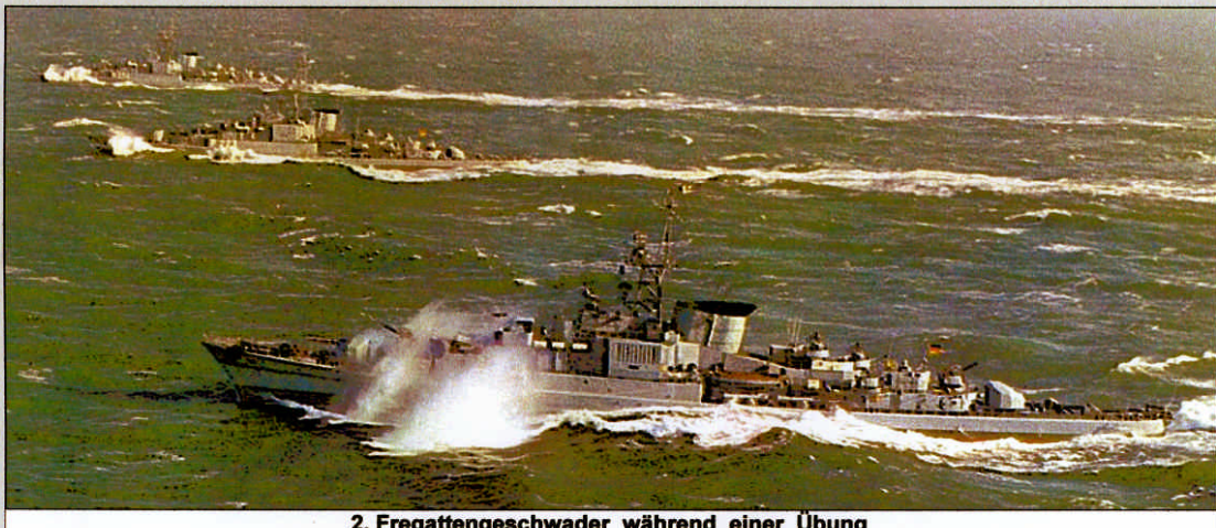
2. Fregattengeschwader während einer Übung

Vom 29.04. bis 07.05.67 erfolgte eine Sturmerprobung zwischen den Färöer- und Shetlandinseln und anschließend das Manöver "Bagible Call" in norw. Und dän. Gewässern. Im August folgten Torpedo Schießübungen und vom 18.10. bis 09.12. die "FOST" (Flag Officer Sea Training) in Portland. Am 13.01.68 lief die "KÖLN" zur ersten "STANAFOLANT" (Standing Naval Force Atlantic) aus und nahm am NATO-Manöver "Match Maker" im Nordatlantik teil. Die Fregatte wurde am 20.06. vom Zerstörer "BAYERN" aus der "STANAFORLANT" abgelöst und lief in ihren neuen Heimathafen Wilhelmshaven ein. Es folgte eine längere Werftüberholung und vom 06. bis 10.06.69 besuchten "KÖLN", "AUGSBURG" und "BAYERN" die schwedische Hauptstadt Stockholm.